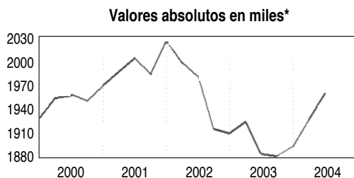
Gráfico 1. Evolución temporal de los autónomos

* Datos adaptados a la nueva metodología de la EPA-2002